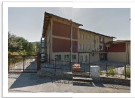
Scuola Primaria e Secondaria Pietrafitta