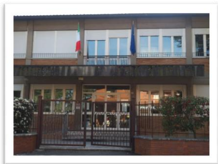
Scuola Secondaria Piegario