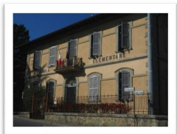
Scuola Primaria Piegario