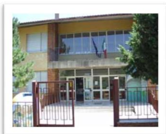
Scuola Primaria Castiglion Fosco