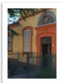
Scuola Infanzia Piegario